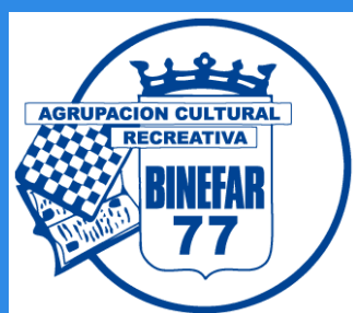
A.C.R. BINEFAR 77