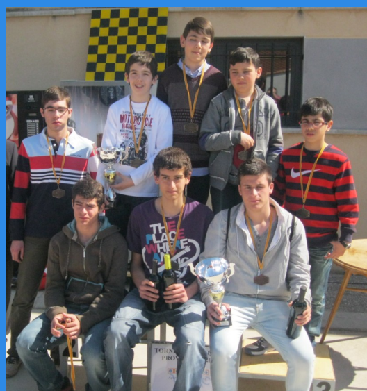
ESCOLARES EQUIPOS 2012

1º. - SISTEMA DE JUEGO: suizo a 7 rondas.